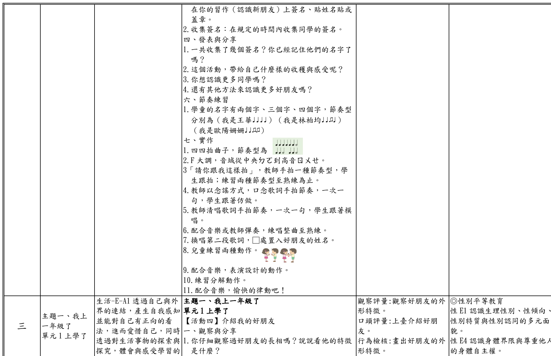
附件 2-5 (國中小各年級適用)